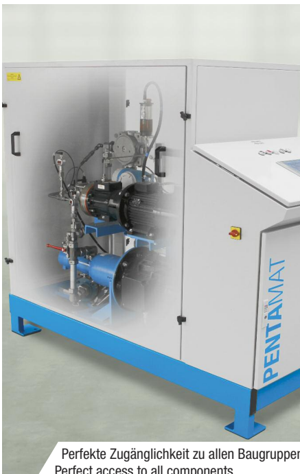
Perfekte Zugänglichkeit zu allen Baugruppen Perfect access to all components

Instead of metering blowing agent directly in the mixing chamber, the processing using blowing agent metering units of the type PENTAMAT takes place in a batch process within a carrier component (usually on the polyol side). Here, the percentage of blowing agent in the component flow can be varied extremely precisely and in almost any ratio. Thanks to the plug-and-play principle, the PENTAMAT can be integrated at any time into existing blowing agent applications. Furthermore, the advanced blowing agent metering unit is optionally available with connection possibilities for further additives. For example, this is necessary if users want to influence the property spectrum of the finished product in a targeted manner by combining different blowing agents. The PENTAMAT machine frame is ergonomic and extremely maintenance-friendly. For example, the large side covers provide perfect access to all components. Further optional equipment features are available to adapt the PENTAMAT for any application.