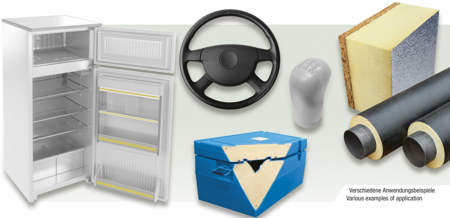
Verschiedene Anwendungsbeispiele Various examples of application