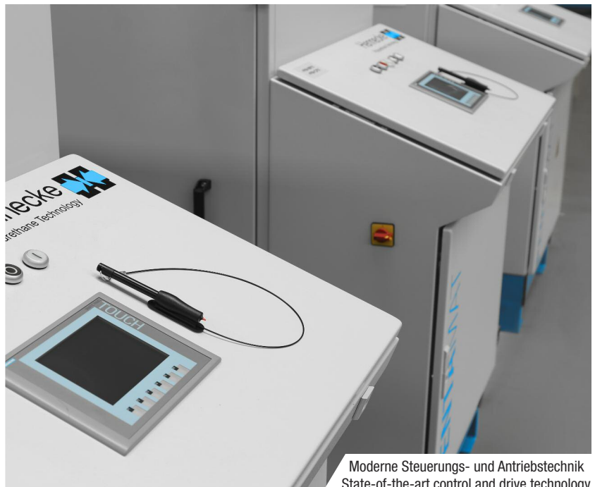
Moderne Steuerungs- und Antriebstechnik State-of-the-art control and drive technology